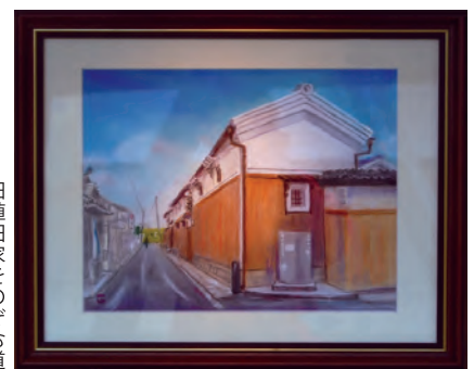
旧植田家をのぞむ道