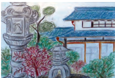
旧植田家住宅の庭