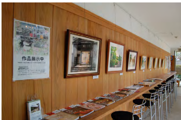
2012年度(前期)ギャラリー展示の様子