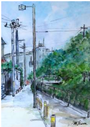
※画像は今年の応募作品(一部)