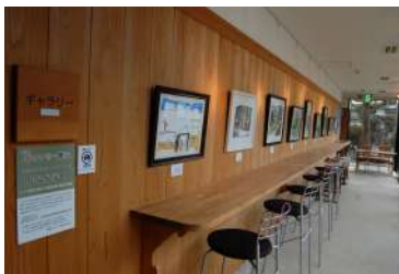
ギャラリー展示の風景