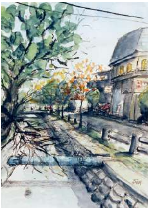
※画像は昨年の作品です(一部)