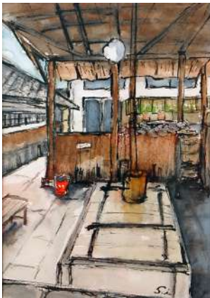
※画像は昨年の作品です(一部)